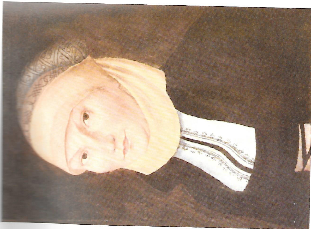
ABB. 1: LUCAS CRANACH D.Ä.: KATHARINA VON BORA